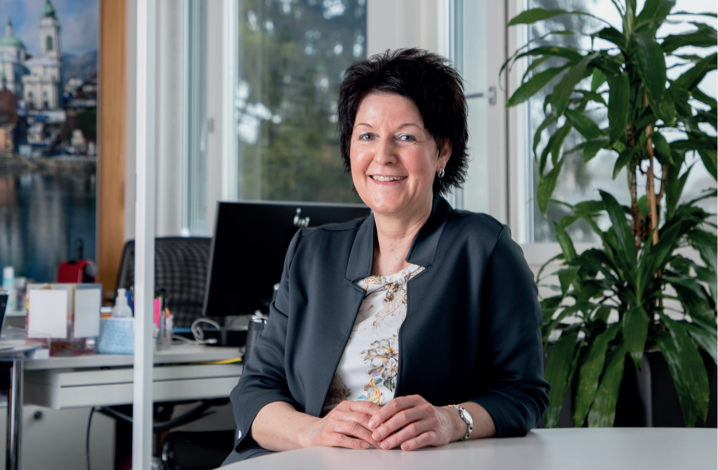
Sandra Kolly, Regierungsrätin des Kantons Solothurn

Regierungsrätin Sandra Kolly im Interview