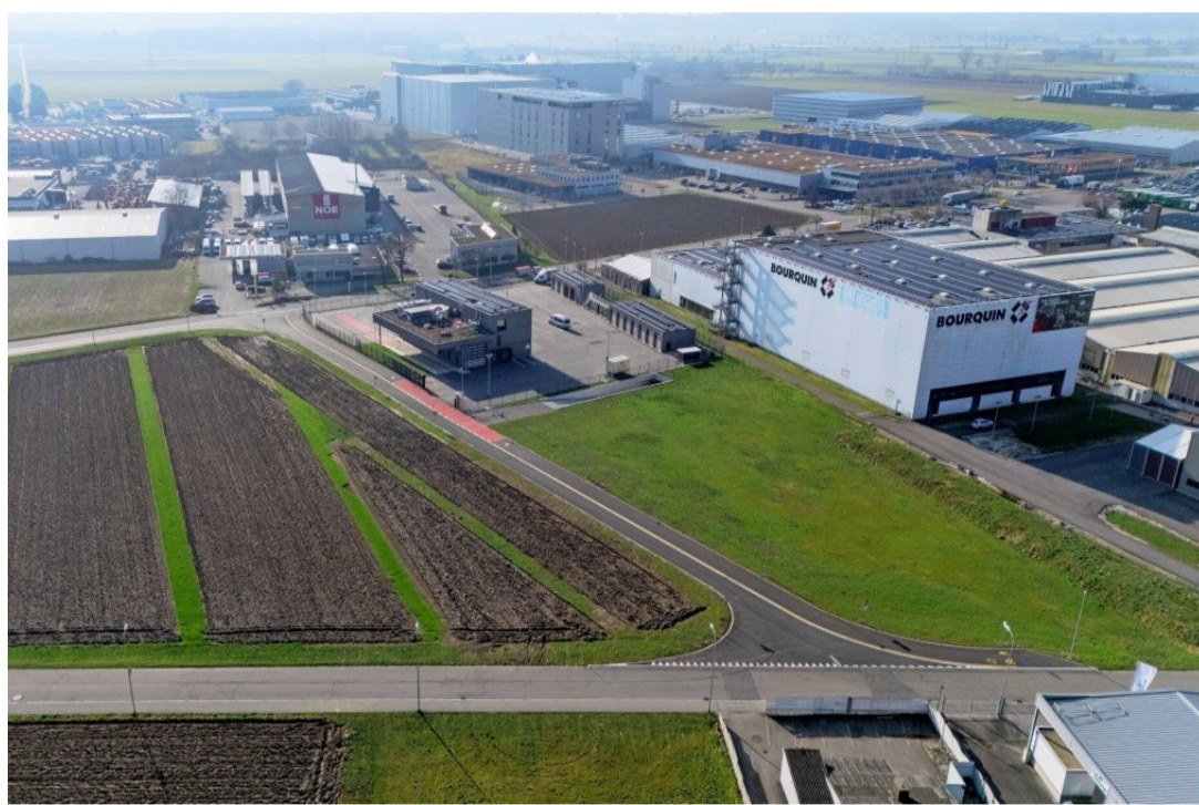
Der neue Kapo-Standort kommt auf die grüne Wiese neben der Firma Bourquin, nördlich des Schwerverkehrskontrollzentrums.

Rémy Wyssmann spricht gar von einem «sensationellen Ergebnis». Er sieht jetzt den Kantonsrat in der Pflicht. Dieser hatte sich im September einstimmig für das Projekt ausgesprochen. Nun müssten sich die Kantonsparlamentarier überlegen, wer denn für die 40 Prozent der Stimmenden stehe, die ein Nein in die Urnen gelegt hatten. Auch